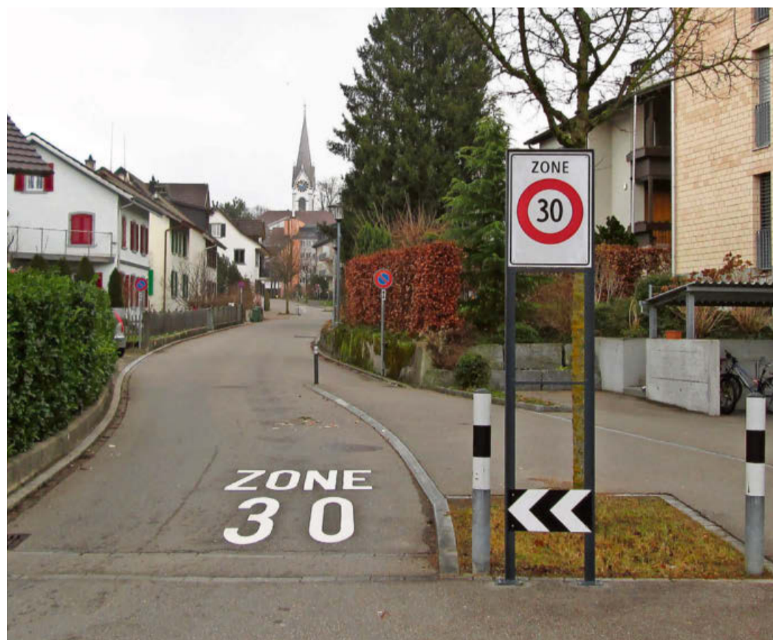
In Uster gibt es schon 14 Tempo-30-Zonen, im Bild diejenige an der Zimikerstrasse.

Doch was ist mit dem Bus? Verliert dieser nicht Zeit, und leidet nicht die Anschlussqualität? Dieses Thema wird in Zürich und Winterthur ja aktuell heiss diskutiert. Der Unterschied zu Uster: In den beiden Grossstädten geht es nicht um Tempo 30 in Wohnquartieren, sondern auf Hauptverkehrsachsen. Das kann für den ÖV bei langen Tempo-30-Strecken in der Tat zu Zeitverlusten führen, die er